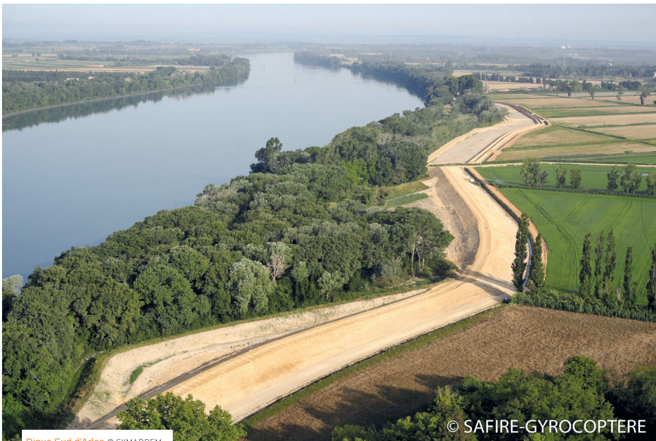
Digue Sud d'Arles